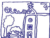
Maison des pinceaux